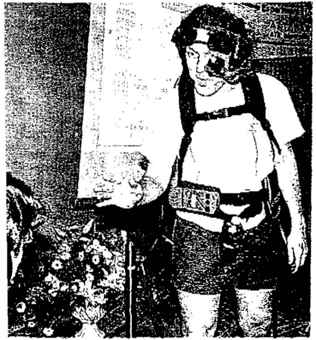
声翻訳 近未来の海外旅行者の安は、こんな感じ？ 音声翻訳システムは、語学の苦手な人の強い味方になりそう。（2面に記事）

携帯パソコンも登場 「アメリカはどんな天気ですか」「ドイツはいかがです」 「アメリカはどんな天気ですか」「ドイツはいかがです」 「アメリカはどんな天気ですか」「ドイツはいかがです」